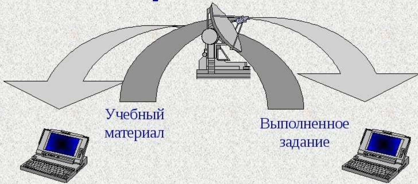
Схема процесса дистанционного образования

Педагог создает определенные условия, предлагает материал в интересной и доступной форме